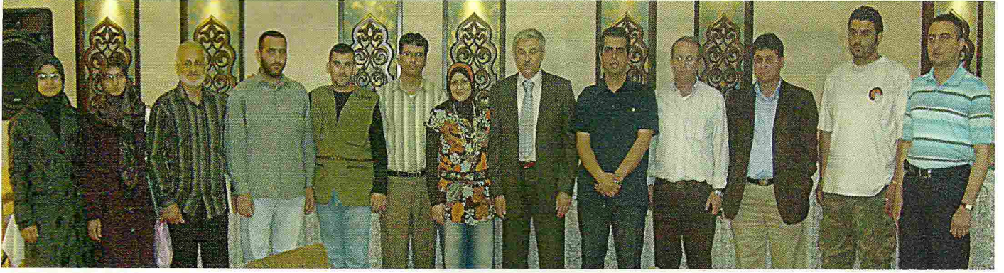
• صورة تذكارية لجميع المشاركين في الحوار